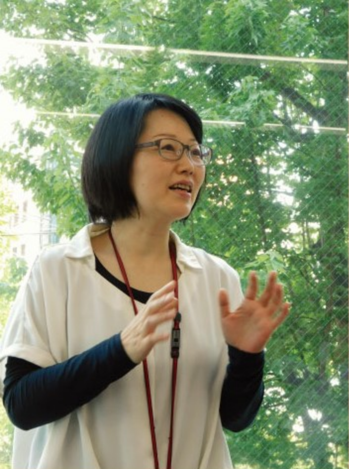
卒業手続きは利用者さんの足跡を辿る作業そのものですね